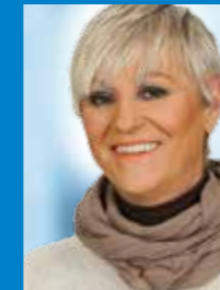
Meta Reisch-Bootsch Liste 1 – Platz 56