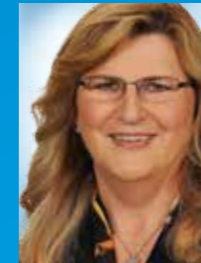
Andja Skojo Liste 1 – Platz 28